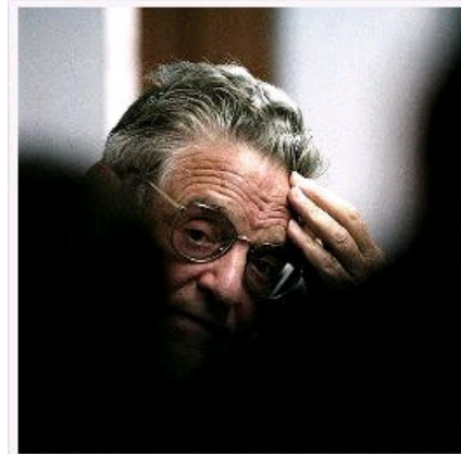
Flaws built into the euro from the start have become acute, Soros told a seminar, warning that the euro crisis could destroy the 27-nation European Union.

Om in de toekomst uiteenlopende groeiverschillen op te vangen en het ontstaan van nieuwe zeepbellen te vermijden, denkt De Grauwe nu aan differentiële reserveverplichtingen. Aangezien binnen een monetaire unie de onderlinge muntpariteiten vastliggen en ook een differentiële rentepolitiek onmogelijk is, wil hij aan banken van snelgroeiende landen een hogere reserveverplichting opleggen om hun kredietexpansie in te toemen. In principe is dit best een leuk idee, ware het niet dat dit veronderstelt dat het vrij kapitaalverkeer aan banden wordt gelegd om zo iets in de praktijk werkbaar te houden. En het bevorderen van vrij kapitaalverkeer was nu juist het economisch objectief en politiek argument waarmee politici uitpakten om het Europroject te rechtvaardigen... Of hoe de eenheidsmunt steeds verder verstrikt geraakt in zijn eigen contradicties.